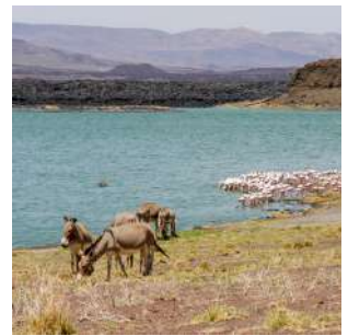
Paesaggi del Nabuyatom