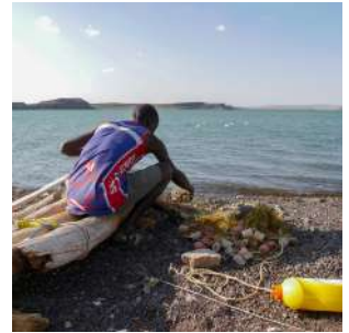
Pescatore sulla sua zattera