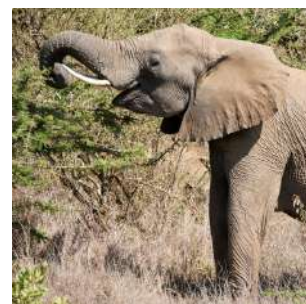
Elefanti nella Mugie Conservancy

Colazione al lodge, durante la quale potremo ammirare la fauna presente nel parco (zebre, facoceri, scimmie, ...). Partenza verso il lago Baringo, attraversando la Mugie Conservancy, un'area protetta che costeggia la strada principale dove, con un po' di fortuna, sarà possibile incontrare degli elefanti. Pranzo con lunch box. Visita di un villaggio dell'ETNIA POKOT, gruppo nilotico presente in questa parte del Kenya e nella regione della Karamoja in Uganda. Dediti alla pastorizia ed all'agricoltura, vivono in capanne ovali di legno e paglia nella savana. Resteremo stupiti di fronte agli accessori delle donne, in particolare le grandi collane circolari. Proseguimento a Nakuru, sistemazione al Punda Milia Camp, cena e pernottamento in camera doppia con servizi privati.