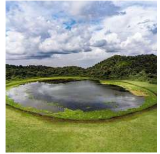
Parco di Marsabit

Arrivo al PARCO DI MARSABIT, oasi montana all'interno di una vasta area desertica, dove percorreremo il sentiero che ci porterà ad avvistare splendidi laghi incastonati nella vegetazione, nonché, con un po' di fortuna, zebre, bufali ed elefanti. Avvicinandoci alla città di Marsabit, incontreremo lungo la strada le donne dell'ETNIA BORANA, riconoscibili per i loro veli dai colori sgargianti. Sistemazione al Jirime Hotel o similare, cena e pernottamento in camera doppia con servizi.