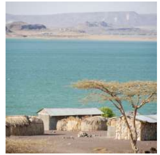
Villaggio El Molo

Passeggiando lungo il villaggio visiteremo le semplici capanne fatte di foglie di palma dum, incontreremo i valorosi uomini di ritorno dalla pesca, che viene effettuata solamente con una zattera fatta di tre pali di palma dum, reti di funicelle ed un arpione per la caccia a coccodrilli ed ippopotami (specie protette, che al giorno d'oggi vengono cacciate in maniera limitata e solamente in alcuni periodi dell'anno, a scopo rituale - l'ippopotamo è considerato il 'dio del lago'). La loro alimentazione è basata sul persico e la tilapia, le due specie di pesce più comuni nel lago, che le donne fanno affumicare o tagliano a striscioline a seccare al sole. A seguire visita del "museo del deserto", che presenta un'esposizione dedicata alla storia, la geologia, la flora e la fauna della regione del lago, nonché oggetti di uso quotidiano delle diverse etnie che vi abitano. Tempo per il relax in piscina presso il lodge. Cena e pernottamento in camera doppia con servizi.