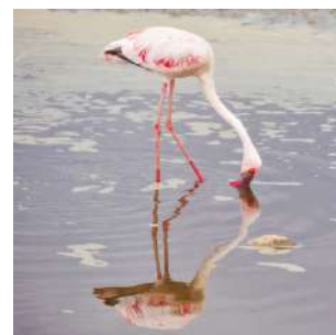
Fenicottero nel Parco Nakuru

Di primo mattino, dopo la colazione, possibilità di safari al PARCO NAKURU, area protetta che circonda il lago omonimo, patrimonio dell'umanità dell'UNESCO. Questo parco è famoso per l'alta concentrazione di uccelli, tra cui fenicotteri, pellicani e trampolieri, ma soprattutto per la presenza di numerosi rinoceronti e giraffe di Rothschild. A seguire partenza verso Nairobi, lungo una strada molto trafficata, con soste per il pranzo in un ristorante locale e per ammirare l'escarpement, il belvedere sulla Rift Valley. Arrivo nella capitale, camere in day use su richiesta. Possibilità di cena al rinomato ristorante Carnivore, per un banchetto a base di carne (oltre a manzo, agnello, pollo e tacchino, vengono servite specialità come le polpette di struzzo e cocodrillo arrosto). Trasferimento in aeroporto in tempo utile per il vostro volo di rientro, fine dei servizi.