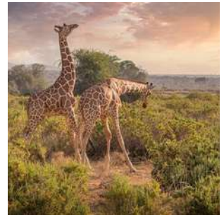
Giraffa reticolata nel Samburu NP

Dopo la colazione partenza verso nord, attraversando la caotica capitale del Kenya. Lungo il tragitto ci fermeremo a Nanyuki per vedere il punto esatto dove passa la linea dell'equatore, e per una vista (nuvole permettendo) delle bianche vette del Monte Kenya, che con i suoi 5.199 metri sul livello del mare è la seconda vetta più alta del continente africano dopo il Kilimanjaro. Pranzo con lunch box lungo il tragitto. Nel primo pomeriggio arrivo nel PARCO SAMBURU (contiguo alla riserva nazionale di Buffalo Springs e quella di Shaba), una delle aree protette più impressionanti del paese, sia per la quantità e diversità di fauna selvaggia, che per gli splendidi paesaggi. Oltre ai grandi felini, sempre molto schivi, e la giraffa Masai, la vera attrattiva del parco sono gli "special 5", animali che si trovano solamente in questo parco: la zebra di Grevy, la giraffa reticolata, lo struzzo somalo, la gazzella-giraffa e l'orice dalle orecchie frangiate. Termine del safari all'ora del tramonto, sistemazione al Samburu Simba lodge o similare, cena e pernottamento in camere doppie con servizi.