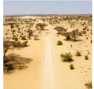
Lungo le piste desertiche

*Se le condizioni della pista lo permettono.