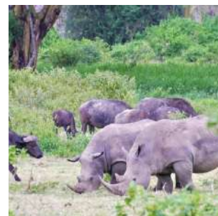
Rinoceronti nel Parco Nakuru