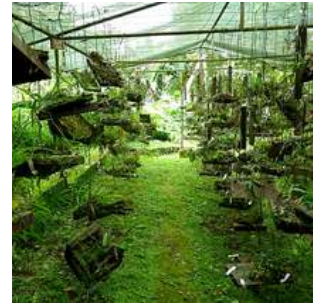
Giardino botanico Bom Successo