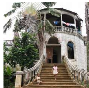
Roca Agua Itzé