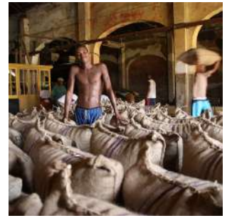
Produzione di cacao

Colazione in hotel e trasferimento verso Trinidad, seconda città del paese. Inizieremo ad ammirare le piantagioni di caffè e cacao, principali prodotti d'esportazione dell'isola, introdotti dai portoghesi nel XIX secolo, dove in passato lavorarono migliaia di schiavi africani provenienti dalle altre colonie, in particolare dall'Angola. Le rocas oggi sono delle "aziende agricole" gestite da delle cooperative, con una produzione di qualità ed eco-sostenibile, assai richiesta nel mercato internazionale. A ROCA MONTE CAFE' visiteremo il Museo del caffè, dove conoscere le differenti varietà che vengono coltivate a Sao Tomé ed ammireremo i vecchi edifici dove avveniva in passato la lavorazione del cacao. A seguire ci dirigeremo al giardino Botanico di BOM SUCCESSO, con più di 400 specie di piante endemiche, ornamentali e medicinali, e 140 diversi tipi di orchidee. Dopo una pausa rinfrescante alla CASCATA SAO NICOLAU, all'interno della foresta, pranzeremo al ristorante-casa-museo Almada Negreiros, con un menù degustazione di specialità locali. Nel pomeriggio rientro in città per una "dolce" sosta presso il produttore di cioccolato più famoso dell'isola, l'italiano Claudio Corallo, per una ricca degustazione. Trasferimento a Neves, sistemazione al Mucumbli Ecolodge o similare, cena libera e pernottamento in bungalow doppio con servizi.