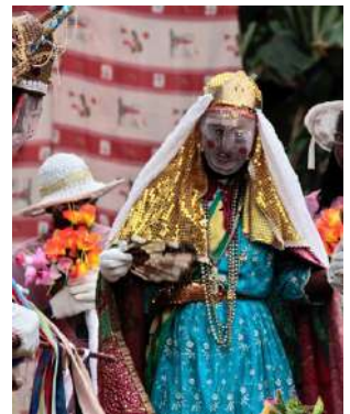
Tragedia del Marchese di Mantova