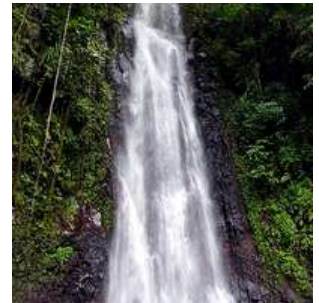
Cascata di Sao Nicolau