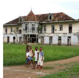
Roca Boa Entrada

Colazione in hotel e visita di ROCA BOA ENTRADA e ROCA AGOSTINHO NETO, dove potremo vedere numerosi edifici coloniali come l'ospedale, la casa padronale e le sanzalas, dove tuttora abitano i lavoratori. Pranzo in un ristorante e proseguimento a SANTANA, dove effettueremo un'escursione in barca all'Ilheu Santana, di origine vulcanica, dove è facile incontrare i pescatori artigianali all'opera. Rientrati sulla terraferma partiremo in direzione sud verso Porto Alegre, con una sosta al punto panoramico dove ammirare il PICO CAO GRANDE, un monolite di basalto alto 800 metri e simbolo del paese. Arrivo all'Eco-hotel Praia Inhame o similare, adagiato su un'incantevole spiaggia orlata di palme, cena libera e pernottamento in bungalow doppio con servizi.