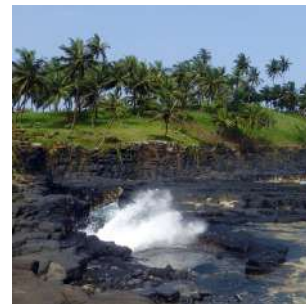
Boca do Inferno

Dopo la colazione in hotel rientreremo verso la capitale con soste nelle località iconiche della costa orientale: BOCA DO INFIERNO, particolare fenomeno naturale; PRAIA SETE ONDAS, ideale per il surf; AGUA ITZE, con la sua spiaggia dei pescatori e l'affascinante roça con vista panoramica sul golfo. All'arrivo pranzo in un ristorante. Nel pomeriggio possibilità di acquisti di prodotti tipici e artigianato nei negozi della capitale. Nel pomeriggio trasferimento in aeroporto in tempo utile per il volo di rientro. Fine dei servizi.