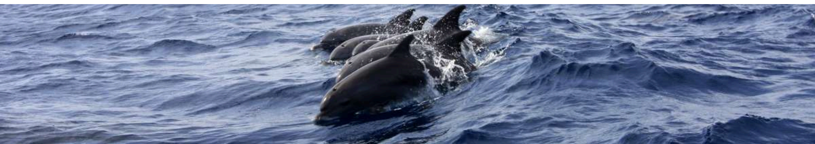
Incontro con i delfini

Colazione in hotel e giornata dedicata all'esplorazione della parte nord-occidentale dell'isola. Andremo alla ROCA DIOGO VAZ, dove, tra le piantagioni di cacao, ci verrà spiegata tutta la filiera di produzione del prodotto simbolo del paese. A seguire ci dirigeremo al villaggio di pescatori di MORRO PEIXE per un'escursione in barca dove poter avvistare delfini, balene pilota e, con un po' di fortuna, le orche che popolano queste acque. Rientro sulla terraferma e pranzo in un ristorante dove, per chi lo desidera, sarà possibile assaggiare i santolas, granchi giganti di questa regione. Sosta alla LAGOA AZUL ("laguna blu"), una splendida insenatura dove troneggiano imponenti baobab e dove sarà possibile effettuare un bagno rigenerante e lo snorkeling. Rientro a Neves, cena libera e pernottamento in hotel.