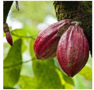
L'isola del cacao

Dopo la colazione assistenza per il cambio degli euro e per l'eventuale acquisto di una scheda telefonica locale. Mattinata dedicata all'esplorazione della cittadina di SAO TOME'. Visiteremo il museo, ospitato nell'antico Forte di Sao Sebastiao, che ci racconta la storia del periodo coloniale e quello della lotta per l'indipendenza, con una mostra che ricorda il massacro di Batepa, in cui nel 1953 vennero uccisi un migliaio di lavoratori impiegati come manodopera nelle piantagioni, che avevano osato ribellarsi al regime di "lavoro forzato retribuito" imposto dai coloni e considerato dall'opinione pubblica internazionale una vera e propria forma di schiavitù. A seguire passeremo nell'affascinante centro cittadino, con numerosi edifici color pastello costruiti dai portoghesi, tra cui spicca la Cattedrale, ed il vivace e frequentatissimo mercato, caratterizzato dai banchi copiosi di frutta e verdura e dalle contrattazioni animate per il pesce fresco. Pranzo in un ristorante. Nel pomeriggio assisteremo allo spettacolo tradizionale Tchiloli, o "Tragedia del Marchese di Mantova e dell'Imperatore Carlo Magno", una forma di teatro recitata e danzata unicamente da uomini, un modo per gli autoctoni di riappropriarsi della storia e farne un oggetto di rivendicazione. Cena libera e pernottamento in hotel.