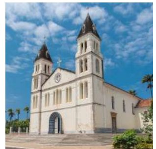
Cattedrale di Sao Tomé