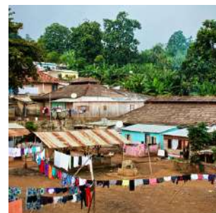
Villaggio di Agostinho Neto