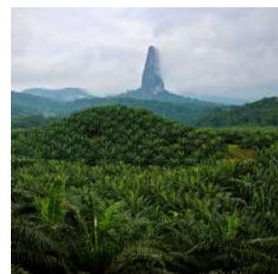
Pico Cao Grande

Colazione in hotel ed escursione in barca verso ILHEU LAS ROLAS, un fazzoletto di terra a poche decine di metri dalla costa, situato verso il "centro del mondo", latitudine 0 e longitudine 0, dove la terra si divide tra emisfero settentrionale e meridionale e si trova il marcatore dell'Equatore. Passeggiata a piedi nell'isola attraverso le piantagioni di palme da cocco per ammirare le spiagge selvagge della costa sud. Pranzo a base di pesce sulla spiaggia, e pomeriggio dedicato al relax balneare sulla magnifica Praia Café. Rientro sulla terraferma, cena libera e pernottamento in bungalow doppio con servizi.