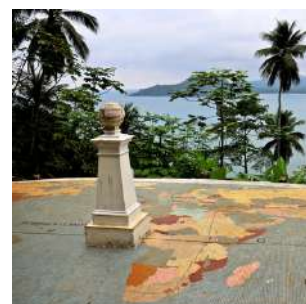
Il marcatore dell'Equatore a Las Rolas

Colazione in hotel e mattinata dedicata alla scoperta della zona meridionale dell'isola e delle due spiagge più famose di Sao Tomè, PRAIA PISCINA e PRAIA JALE'. Troveremo spiagge assai differenti, alcune di sabbia bianca finissima, bagnate da acque cristalline, altre di sabbia nera e scogli, dal fascino tutto particolare. Pranzo in un ristorante e pomeriggio dedicato al relax balneare o possibilità di trekking (circa 2 ore) in una lussureggiante vegetazione. Cena libera e a seguire escursione notturna per l'avvistamento delle tartarughe marine dove, con un po'di fortuna, assisteremo all'incredibile corsa verso il mare delle tartarughe appena nate. Pernottamento in bungalow doppio con servizi.