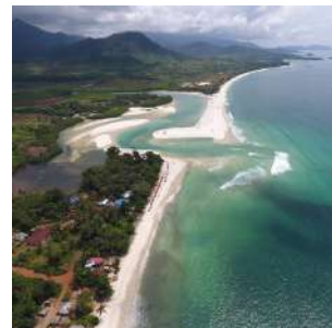
River n°2 Beach

Colazione all'hotel e passeggiata a LUMELY BEACH, la popolare e affollata spiaggia cittadina, che nel weekend si anima e diviene luogo d'incontro per giovani e famiglie. A seguire attraverseremo alcuni VILLAGGI KRIO, dalle case colorate con i tetti di legno, costruite dai discendenti degli schiavi liberati. Partenza per il villaggio di pescatori di TOMBO, dove potremo osservare gli uomini scaricare il pesce sulla spiaggia ed il frenetico viavai delle donne che lo sistemano in ceste pronte per l'affumicatura. Trasferimento a BUREH BEACH, la spiaggia selvaggia più conosciuta del paese, dove sarà possibile rilassarsi all'ombra delle palme, nuotare nelle acque calde e calme della laguna interna, o passeggiare lungo la battigia, in uno splendido scenario. Pranzo in un ristorante sulla spiaggia. Proseguimento al TACUGAMA CHIMP SANCTUARY e sistemazione al Tacugama Lodge*, situato nella foresta, cena e pernottamento in bungalow doppio con servizi.