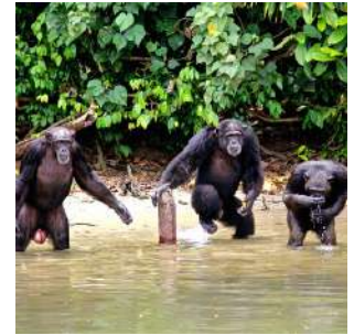
Scimpanzé nelle isole