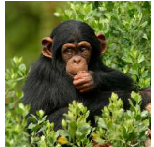
Tacugama Chimp Sanctuary

Dopo la colazione visita del TACUGAMA CHIMP SANCTUARY, un importante e pionieristico centro di riabilitazione e reinserimento nella natura per scimpanzé tenuti in cattività. Qui potremo osservare da vicino le attività di recupero di questi primati da parte dell'equipe veterinaria che con tanta dedizione si occupa di loro, e avvistare alcuni esemplari già liberati nella rigogliosa foresta pluviale che circonda il centro. Pranzo in un ristorante e seguire partenza per KENEMA, capoluogo della Eastern Province e capitale indiscussa dell'industria estrattiva dei diamanti. All'arrivo, se il tempo lo permette, potremo curiosare tra le numerose botteghe cittadine in cui si vendono al dettaglio diamanti, oro e altre pietre preziose. Sistemazione alla Paloma Guesthouse o similare, cena libera e pernottamento in camera doppia con servizi.