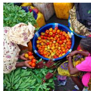
Sul ferry per Freetown