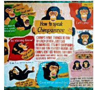
How to speak Chimpanzee

Colazione al lodge e giornata libera a disposizione per il relax al mare o nelle piscine, snorkeling, kayak o paddle nella laguna. Possibilità di escursione in barca alle ISOLE DEGLI SCIMPANZÈ, un piccolo arcipelago di isolotti fluviali situati alla foce del fiume Farmington, in cui vivono poco meno di un centinaio di scimpanzé sopravvissuti ad anni di esperimenti per testare nuovi medicinali in un centro di ricerca farmaceutica aperto negli anni '70 nei pressi di Monrovia dal "New York Blood Center", in cui questi primati venivano utilizzati come cavie da laboratorio per la loro impressionante somiglianza genetica con l'uomo. Nel 2006 gli Stati Uniti hanno interrotto il flusso di finanziamenti, il centro ha sospeso le attività, e gli scimpanzé, abituati a vivere in cattività e totalmente dipendenti dall'uomo, sono stati abbandonati su queste isole. La loro poteva essere una condanna a morte ma alcuni volontari del "Liberia Chimpanzees Rescue" si sono attivati per fornire assistenza e aiuto e oggi l'arcipelago ospita una grande comunità di scimpanzé in salute, suddivisi in piccoli gruppi e disseminati nelle varie isole. Avvicinandoci con la barca, potremo osservare numerosi esemplari che faranno capolino dalla boscaglia o si arrampicheranno sulle mangrovie per curiosare, nella speranza di ricevere da noi qualche mango. Pranzo e cena liberi al Libassa Eco Lodge. Pernottamento in bungalow doppio con servizi.