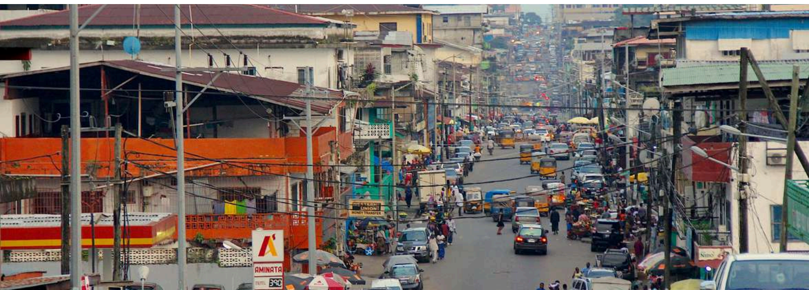
Per le vie di Monrovia