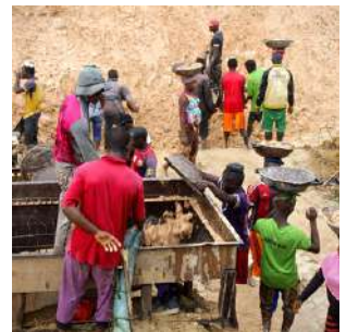
Miniera di diamanti