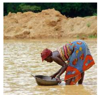
Setacciando nel fiume

Di primo mattino, dopo la colazione, partenza verso la FRONTIERA CON LA LIBERIA. Giornata dedicata al trasferimento, pranzo con lunch box. Disbrigo delle formalità doganali ed arrivo nel tardo pomeriggio a Robertsport, città costiera affacciata sull'Atlantico, considerata un paradiso per chi ama cavalcare le onde dell'Oceano sulle tavole da surf. Sistemazione al Nana's Lodge o similare, situato sulla spiaggia. Cena libera e pernottamento in bungalow doppio con servizi.