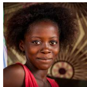
Benvenuti in Sierra Leone!

Dopo la colazione partenza per FREETOWN, capitale della Sierra Leone, con attraversamento del fiume in ferry, dove il ponte si trasforma in un vero e proprio "mercato galleggiante". Una volta sbarcati ci dedicheremo ad un city tour il cui percorso si snoderà tra trafficate vie cittadine brulicanti di persone indaffarate nelle più varie attività, e quartieri più tranquilli dove potremo apprezzare le architetture coloniali di alcuni edifici pubblici come la Court of Justice, e quelle di impronta krio, come la St John's Maroon Church, chiesa metodista costruita nel 1820 dai primi schiavi rientrati dalla Jamaica. Nei pressi del Cotton Tree, il maestoso albero simbolo della città, visiteremo il Museo Nazionale, con la sua interessante collezione di maschere, tamburi e manufatti afferenti alle varie etnie della regione, ed infine il mercato artigianale, dove potremo trovare pregiate maschere, monili e antiche monete.