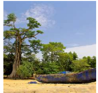
La spiaggia di Robertsport

Dopo la colazione, mattinata libera da dedicare ad una passeggiata nel pittoresco villaggio dall'atmosfera caraibica, al trekking verso il relitto o al relax sulla magnifica spiaggia di ROBERTSPORT, amata dai surfisti, che si accampano sotto l'enorme albero di ceiba che domina la battigia. Pranzo in un ristorante e nel pomeriggio trasferimento a Monrovia, capitale del Paese, e prime visite della città se il tempo lo permette. Sistemazione al Cape Hotel o similare, cena libera con possibilità di assaggiare freschissimi crostacei e sushi al famoso ristorante del Mamba Point. Pernottamento in camera doppia con servizi.