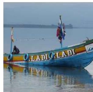
Imbarcazione gladi gladi