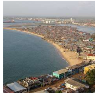
Vista su Monrovia dal Ducor Hotel