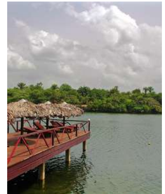
Laguna al Libassa