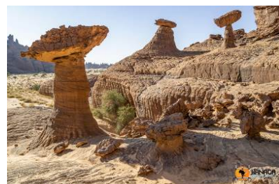
Bizarre formazioni dell'Ennedi