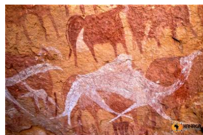
Pitture rupestri di Terkei

Colazioni, pranzi e cene preparati dal nostro cuoco, pernottamenti al campo in tende igloo.