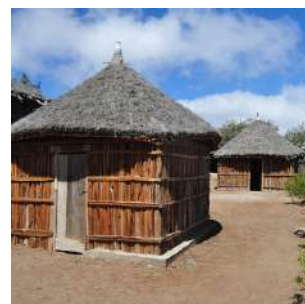
Campement du Day

Dopo la colazione partenza alla scoperta della FORESTA DU DAY, macchia verde a 1.500 mt sul livello del mare che offre incredibili scorci sul golfo di Tadjoura. Oltre ad una flora incredibilmente varia, questa foresta é famosa per essere l'habitat del francolino di Gibuti, specie endemica, e di fornire rifugio a cervi, scimmie e...leopardi. Pranzo pic nic e proseguimento fino a Bankoualé attraverso dei bei paesaggi montani ed accampamenti nomadi. Sosta al villaggio di ARDO, dove le donne Afar hanno creato una cooperativa artigianale dove poter veder realizzare le famose ceste. Arrivo alla verde oasi di BANKOUALE', passeggiata a piedi alla scoperta dei suoi dintorni, fatti di incantevoli giardini ed alberi da frutto e corsi d'acqua. Cena e pernottamento al Campement, in capanne tradizionali dotate di letto, docce e bagni spartani in comune.