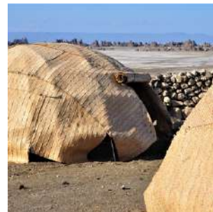
Risveglio al Campement d'Asboley

* Durante il trekking ci saranno portatori Afar con i loro dromedari. Chi non volesse effettuare il percorso a piedi, potrà proseguire in 4x4 per il lago Assal con gli autisti.